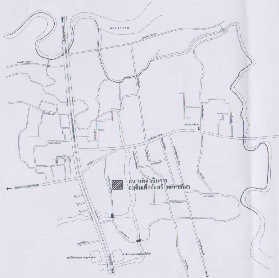
แผนผังแสดงบริเวณดำเนินการ โครงการถมดินเพื่อก่อสร้างสนามกีฬา